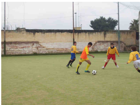
Sopra: le squadre degli istituti "Don Tonino Bello" e "A. De Renzio", che hanno inaugurato il torneo lo scorso 4 marzo.

Le prime due classificate si incontreranno nella finale prevista per martedì 5 aprile, con inizio alle ore 9.30.