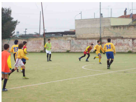
Sopra: una fase di gioco del torneo di calcio a otto per le scuole secondarie di primo grado. Ma il trofeo School Cup non è solo sport. Come ogni anno, infatti, anche questa XII edizione propone l'approfondimento di un tema culturale. Per il 2011 è l'Unità d'Italia.

Lo School Cup, da sempre, non è soltanto sport, ma anche cultura. Per questo, anche quest'anno, si è avviato un lavoro di approfondimento di un tema culturale che, per il 2011, non può che essere l'Unità d'Italia, di cui si celebra il centocinquantenario. I giovani e la storia è il tema di questa XII edizione del trofeo School Cup e proprio con la storia stanno facendo i conti i ragazzi delle scuole bitontine. In particolare con la storia del Risorgimento italiano.