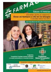
A sinistra: il manifesto promozionale della Giornata di Raccolta del Farmaco.

patronato della Presidenza della Repubblica e con il sostegno della Federfarma Provinciale, di Federchimica e di Anifa (Associazione Nazionale dell'Industria Farmaceutica dell'Automedicazione).